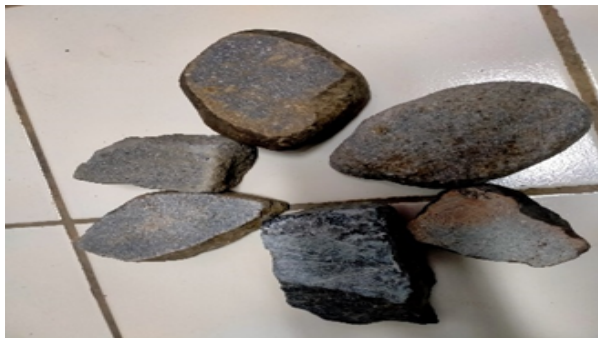
Gambar 1 Bentuk Sampel Batuan

Sampel batuan yang akan diukur kecepatan gelombang primer dan sekundernya menggunakan alat SOWAN disiapkan dengan memotong sampel batuan menggunakan alat gerinda batu pada kedua permukaan batuan. Panjang dari sampel batuan diukur menggunakan penggaris. Batuan yang telah dipotong selanjutnya diletakkan di antara transmit sensor dan receiver sensor. Bentuk sampel batuan dapat dilihat pada Gambar 1.