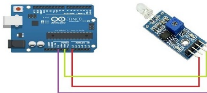
Gambar 3 Skema rancangan sensor fotodiode

Langkah perancangan sensor yaitu dengan menghubungkan Arduino Uno R3 dengan sensor fotodiode yang memiliki 4 buah pin yaitu A0, D0 GND, VCC. Pin A0 dihubungkan dengan pin A0 pada Arduino Uno R3, pin GND dihubungkan ke GND pada Arduino Uno R3, pin VCC dihubungkan ke tegangan 5 V pada Arduino. Rangkaian ini akan dihubungkan ke laptop untuk melihat berapa nilai tegangan yang dihasilkan dengan jarak-jarak tertentu. Skema rancangan sensor fotodiode ditunjukkan pada Gambar 3.