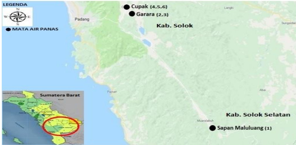
Gambar 1 Lokasi pengambilan sampel

berada pada daerah Cupak Kabupaten Solok (4,5,6). Teknik pengambilan sampel pada tiap lokasi sama dengan lokasi lainnya, sampel di ambil secara radial membentuk lingkaran di sekitar tepi sumber mata air panas. Pada setiap titik akan diambil tiga sampel tiap pengujian dan diberi label huruf (A-C). Lokasi pengambilan sampel dapat dilihat pada Gambar 1.